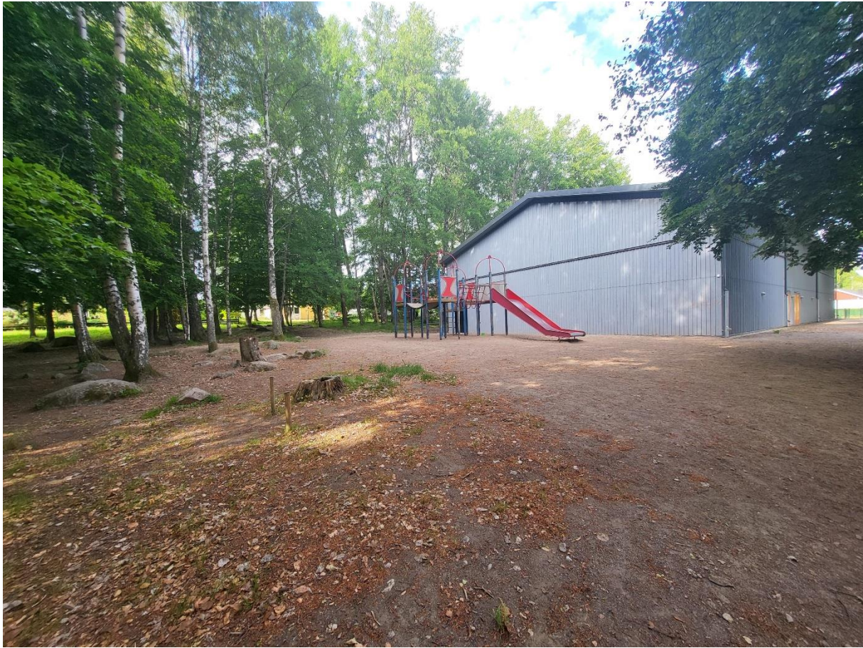
Figur 3. Fotografi av den östra delen av den planerade byggrätten.