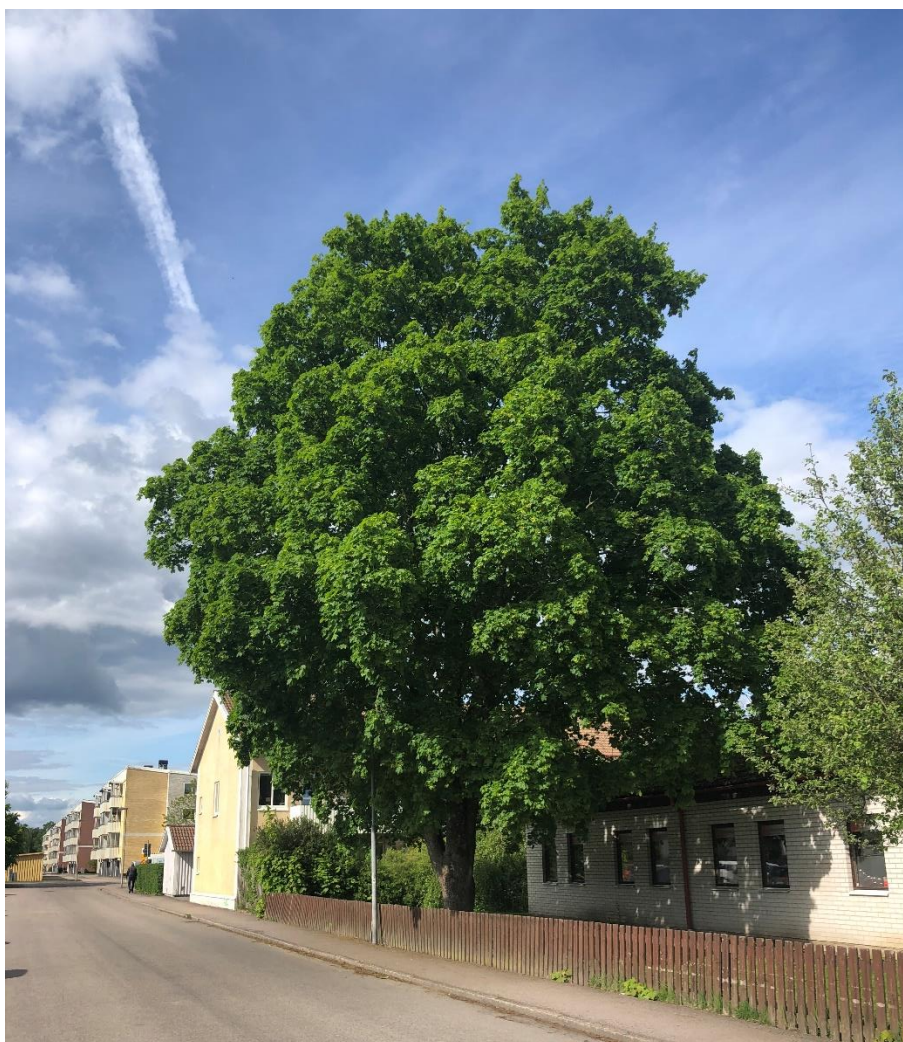
Fig 2. Trädet utmed Lärkgatan vid Fastigheten är en stor och äldre skogslönn med bra vitalitet.

VIÖS AB Kaunasvägen 42 352 49 Växjö Telefon 0470-65784 Telefax 0470-XXXXXX