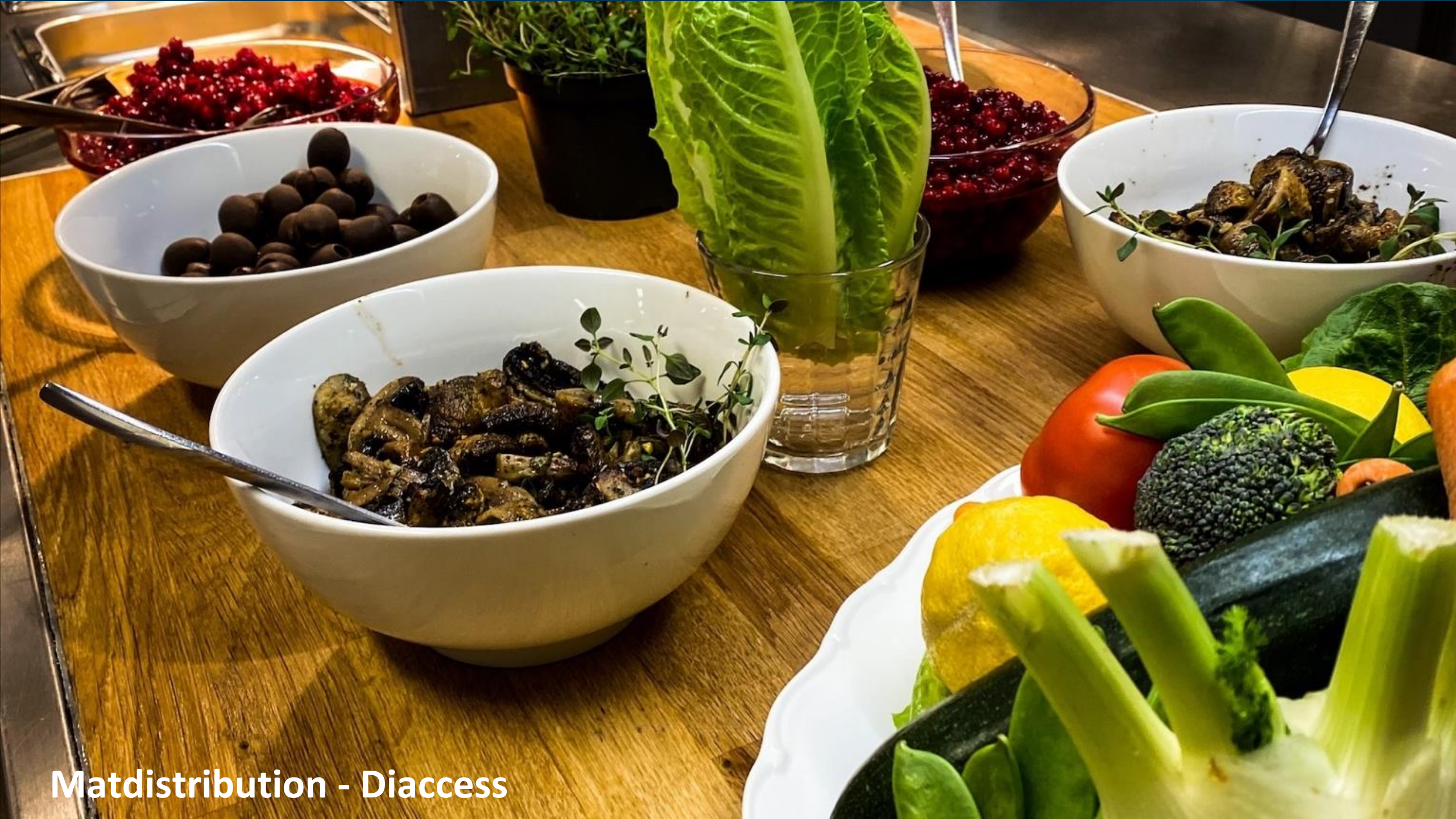
Matdistribution - Diaccess